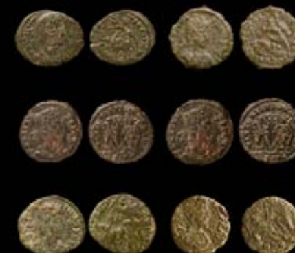
TESORILLO DE MONEDAS ROMANAS Bronce Villae Romana de "Los Cipreses", Jumilla (Murcia) Entre 318-348 d. C.