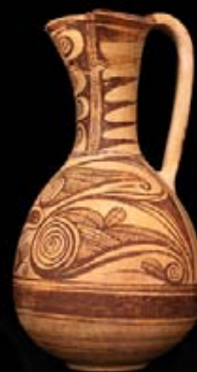
OINOCHOE IBÉRICO PINTADO Cerámica pintada Necrópolis del Cabezo del Tío Pío, Archena (Murcia) Siglos II-I a.C