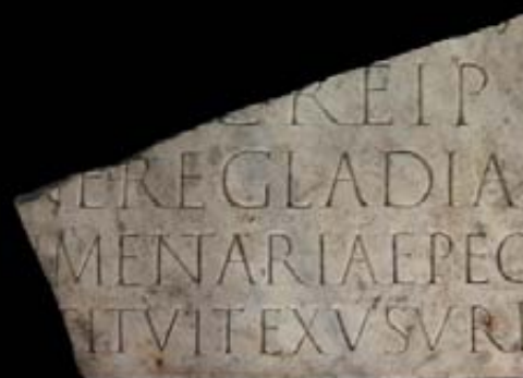
FRAGMENTO DE PLACA EPIGRÁFICA Mármol blanco con epígrafe en letra capital cuadrada Arco de la Caridad nº 8-12 (Termas del Foro), Cartagena (Murcia) Siglo II d.C.