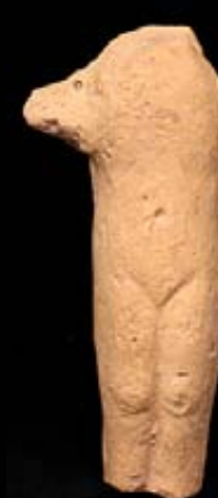
FIGURA VOTIVA (EXVOTO) Terracota figurada y realizada mediante la técnica a molde y retoque Huerto del Paturro, Portmán (Cartagena) Siglo II d.C.