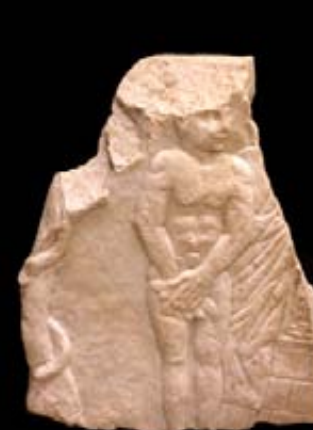
SARCÓFAGO DE ADÁN Bajo relieve de mármol de Carrara Begastrí, Cehegín (Murcia) Primer cuarto del siglo IV d.C.