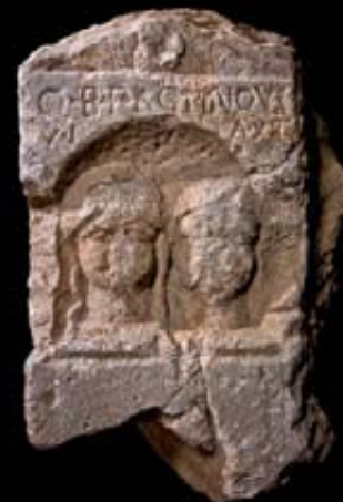
ESTELA FUNERARIA Mármol blanquecino-grisáceo, quizá de las canteras del Cabezo Gordo Cerro del Molinete, Cartagena (Murcia) Primera mitad del siglo I d.C.

Finalmente, aparte de las excavaciones en instalaciones mineras romanas como el Cabezo del Pino (Sierra de Cartagena-La Unión), destacaremos, por su singularidad al abordar campos muy poco conocidos en la arqueología clásica regional, los proyectos arqueológicos en instalaciones militares de la zona de Caravaca-Archivel, de época tardorepublicana, y en una serie de instalaciones, de importante entidad arquitectónica, en el limes fronterizo visigodo-bizantino en la zona del Parque Regional del Valle en Murcia (Castillo de los Garres, Los Teatinos, etc).