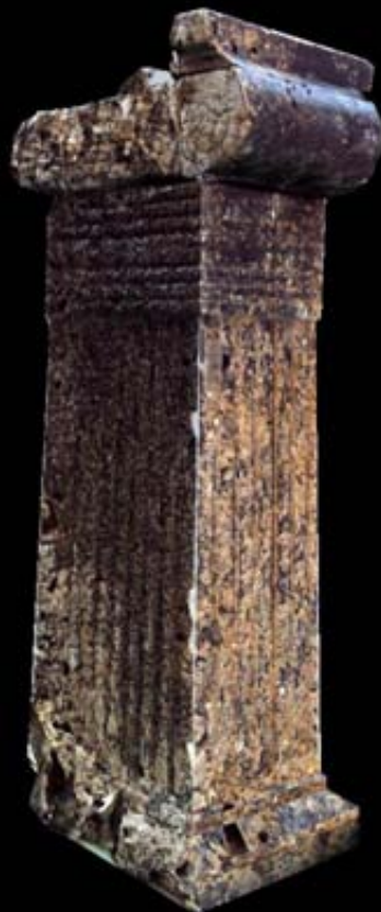
PEDESTAL Piedra (dolomía) Pecio del Bajo de la Campana 1, San Javier (Murcia) Finales siglo VII a.C

Finalmente, hemos de reseñar las recientes investigaciones subacuáticas en el pecio del Bajo de la Campana (La Manga), con un espectacular lote de materiales de lujo: colmillos de elefante, timateria, aras, cargamentos cerámicos, lingotes metálicos, todo ello en proceso de recuperación en los laboratorios del centro del ARQUA en Cartagena.