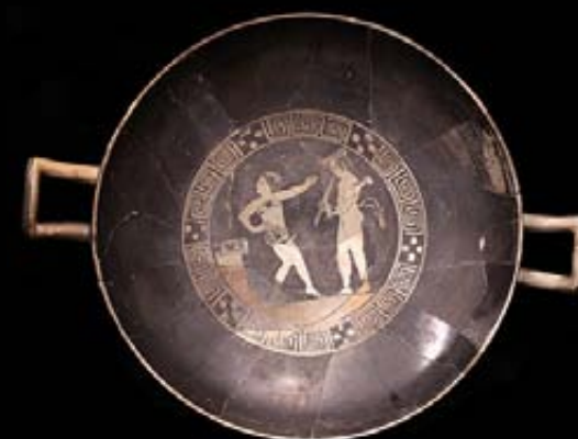
KÍLIX ÁTICO DE FIGURAS ROJAS Cerámica Coimbra del Barranco Ancho, Jumilla (Murcia) Aprox. 400 a. C.