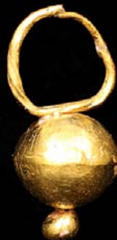
PENDIENTE Oro Santuario íbero-romano de Cerro de la Ermita de la Encarnación Caravaca de la Cruz (Murcia) Siglos IV-II a.C.