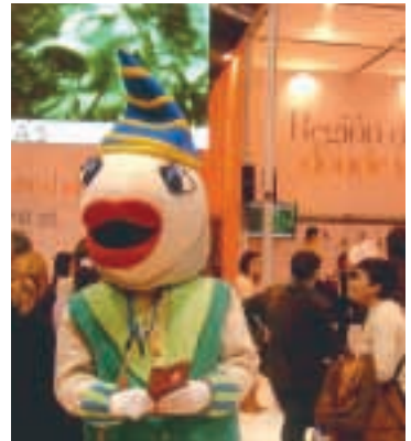
La mascota, junto al stand de la Región de Murcia en Fitur.

El Entierro de la Sardina estuvo presente en la Feria Internacional de Turismo de Madrid (Fitur), gracias al stand de la Región de Murcia. Durante el tiempo que duró el evento, nuestra mascota fue una de las piezas más llamativas del stand murciano, desde el que repartió balones y trípticos editados en cuatro idiomas con una sinopsis de lo que significa nuestro Entierro de la Sardina . El tríptico también contenía las bases de un sorteo de una estancia de fin de semana para cuatro parejas, así como otras tantas sillas para que los ganadores pudieran disfrutar de la cabalgata del Entierro de la Sardina .