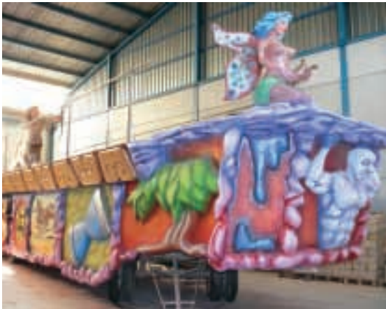
La nueva carroza del grupo Centauro, obra de Toni Forner, con poligrabados de Alejandro Galindo.

Por otra parte, nuestra participación en el ámbito social se centra en la aportación económica mensual a la institución de Nuestro Padre de Jesús Abandonado, y en la visita que tradicionalmente realizamos, el jueves de la semana de nuestro querido Entierro de la Sardina , al hogar de los niños huérfanos en la Calle Santa Teresa.