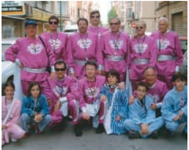
El grupo Momo en su visita a Getafe

Durante el pasado ejercicio, el Grupo Sardinero Momo de nuevo fue invitado por las Casas Regionales de Getafe y Palma de Mallorca a participar en sus celebraciones, tal como ocurrió el año anterior. El 9 de junio, día de la Región de Murcia, nuestro grupo fue recibido por el alcalde de Getafe en la Casa Consistorial de dicha localidad, haciéndole entrega nosotros, a su vez, de una placa conmemorativa. Durante la mañana nuestro grupo desfiló por las calles de Getafe, repartiendo en mano diversos objetos y pequeños juguetes, teniendo mucho éxito entre el público asistente. Ya por la tarde participamos en el desfile, que fue retransmitido en directo por Telemadrid. En él participaron nada menos que 60 carrozas, siendo la del grupo Momo la única que repartió entre los espectadores los tradicionales juguetes, lo que ocasionó que fuera necesaria la escolta policial durante todo el trayecto.