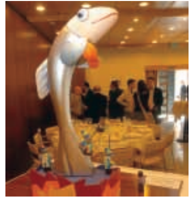
Maqueta del Catafalco de la Sardina 2005.

El viernes 7 de abril, tuvo lugar en los Salones del Hotel Silken 7 Coronas de nuestra capital la presentación de la maqueta del Catafalco de la Sardina. Al acto acudió una importante representación de todos los medios de comunicación, el autor de la obra –el artista valenciano Toni Fornés Quijano– y representantes de la Caja de Ahorros del Mediterráneo. Tras descubrir la maqueta, Fornés explicó el simbolismo del Catafalco a todos los presentes.