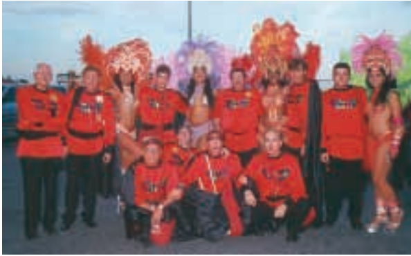
Miembros de Momo acompañados de bellísimas brasileñas, en su visita a Palma de Mallorca.

El segundo evento en el que participamos en la primera semana de mayo fue la celebración del día de la Casa Regional de Murcia en Palma de Mallorca. Empezamos las celebraciones eligiendo al Gran Pez y Doña Sardina , figura esta última que fue asumida por la consejera de Inmigración de Palma de Mallorca. En el desfile de la tarde participaron cuatro carrozas, un grupo de brasileñas, otro de Mayores de Palma de Mallorca, tres charangas y una exhibición de cincuenta motos de gran cilindrada, a lo largo de un recorrido de 1,5 kilómetros.