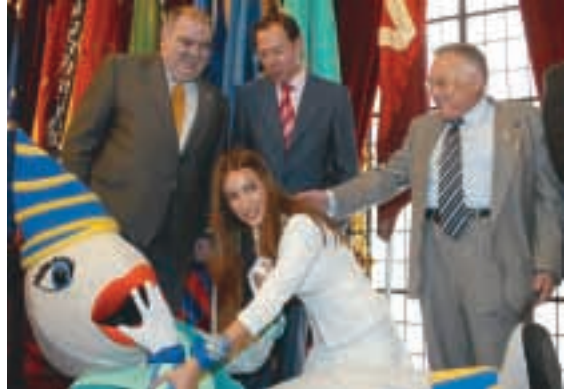
Presentación del Gran Pez y Doña Sardina en el Ayuntamiento.

El jueves 20 de abril, el Comité Ejecutivo, siguiendo la tradición de años anteriores, se desplazó al Hospital Virgen de la Arrixaca de El Palmar, junto al Gran Pez y Doña Sardina . Ya en el centro hospitalario, se repartieron juguetes entre todos los niños hospitalizados en las diferentes estancias de la ciudad sanitaria, lo que dio lugar a momentos de extrema emotividad. Tras la visita al hospital, un