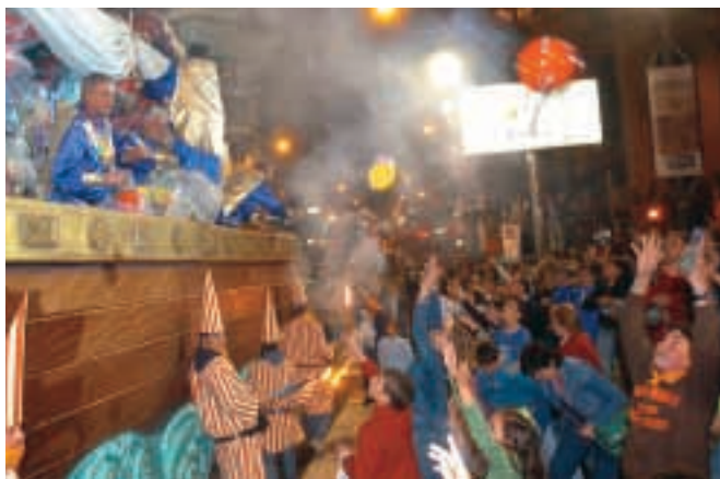
Reparto de regalos desde las carrozas de los grupos sardineros.

Seguidamente, comenzamos el día más importante de nuestro festejo con los pasacalles. Los grupos, arropados por sus charangas y car-