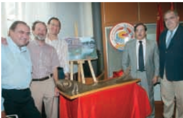
Presentación de la maqueta del monumento de la Sardina .

El monumento tiene 25 metros de largo por cuatro metros de altura en su parte más alta, y por su boca saldrá un chorro de agua de 12 metros. La Agrupación Sardinera se ha hecho cargo de su promoción, el Ayuntamiento de Murcia se ocupará de su mantenimiento y la Confederación Hidrográfica del Segura ha prestado la ayuda técnica necesaria.