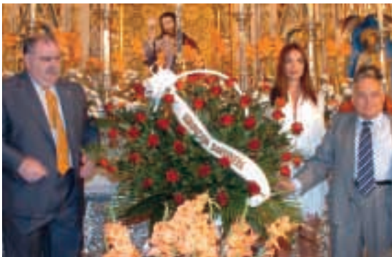
Ofrenda floral a la Virgen de la Fuensanta.

El miércoles 19 de abril se iniciaron las actividades sardineras con la ofrenda floral a la Virgen de la Fuensanta y la celebración de la tradi-