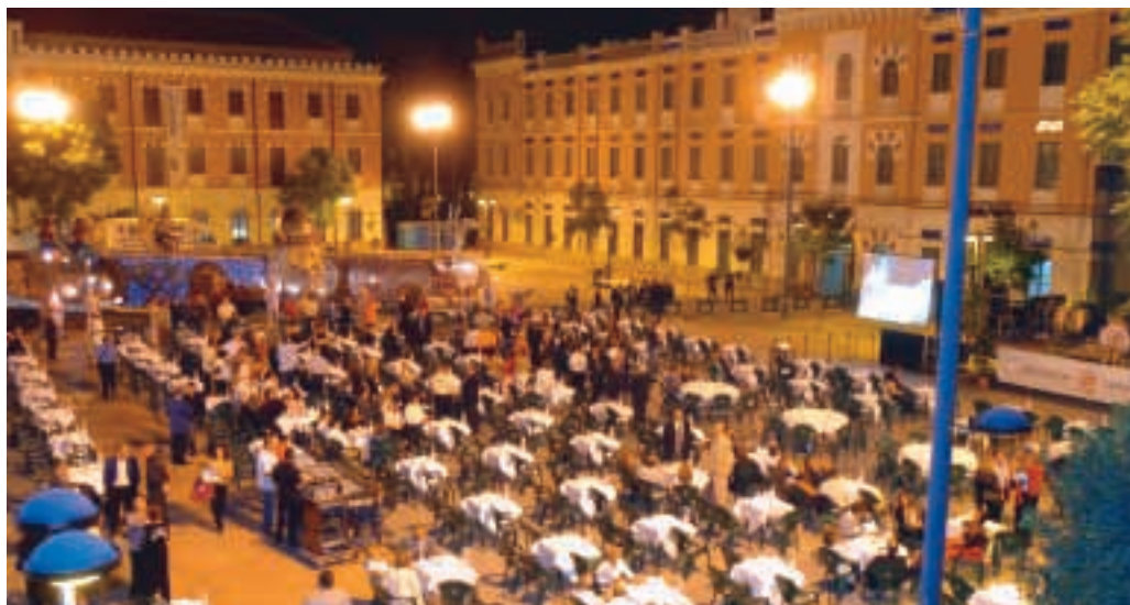
Inauguración del Museo de la Agrupación Sardinera y su sede social.

nueva Sede y el Museo Sardinero, ubicados en el pabellón II, en el primer piso, del mencionado y emblemático Cuartel de Artillería.