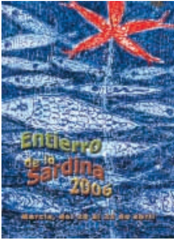
Portada de la Revista de la Sardina 2006.