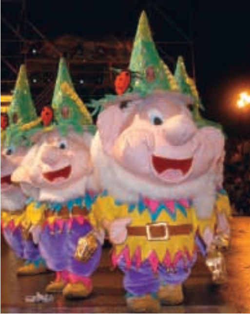
Desfiles del Entierro de la Sardina 2006.

gados de juguetes, desfilaron por las céntricas calles de la ciudad repartiendo alegría a cuantos se cruzaban con ellos.